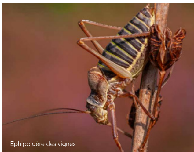
Ephippigère des vignes