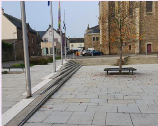
Ajouts de bandes podotactiles sur les marches devant la mairie.

L'objectif de la mise en accessibilité est que toute personne porteuse de handicap ou à mobilité réduite puisse se déplacer et circuler en tout point de l'agglomération.