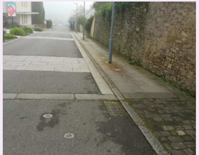
Suppression des potelets sur l'avenue de la Monneraye.

Après trois déambulations dans le centre-ville des aménagements ont été réalisés.