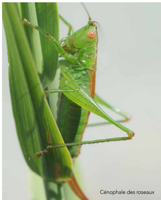
Cénophale des roseaux