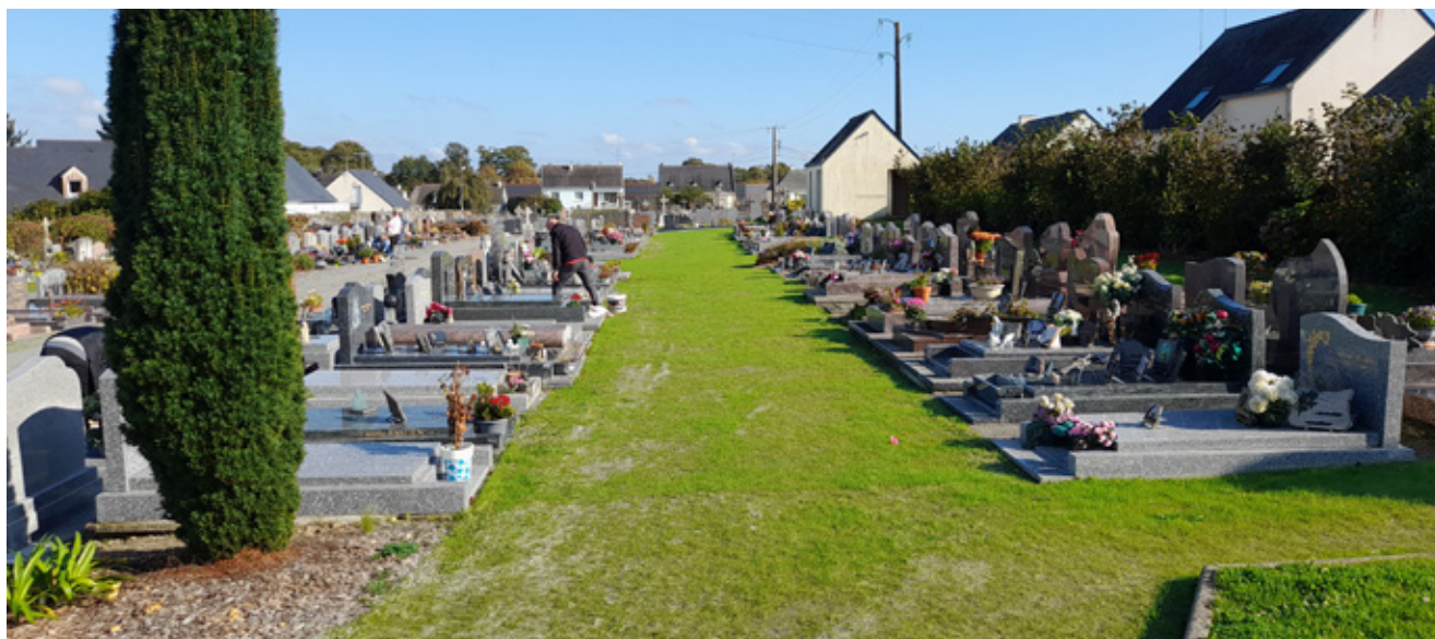
Dans le cimetière du centre-ville, les petites allées ont été végétalisées pour reverdir le site.