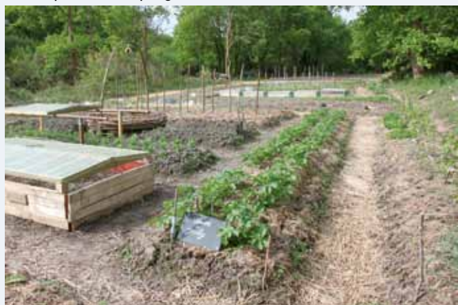
Les jardins du clos du poivre

Rencontres conviviales, échanges d'astuces jardinières, balades botaniques sont au programme de cet évènement.